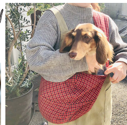
看板犬のマサルくん

【広告】 ♥大阪でペットの健康をサポートするサロンをしています。 ♥ペットケアサロン「Teco★Teca」 ♥ Web: http://www.smiral.co.jp ♥