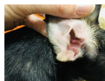
イメージ画像:写真AC